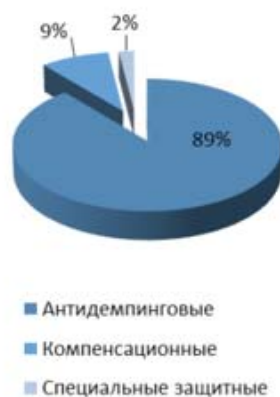
Рис. 2. Структура применяемых защитных мер ВТО

Наиболее популярными и широко применяемыми защитными ограничениями являются антидемпинговые меры (рис. 2). Это объясняется их выборочной направленностью. Также названные меры отличаются высокой степенью эффективности и проработанным механизмом расследований.